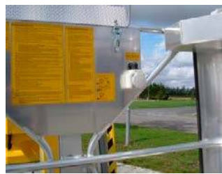
Zásuvka 230 V v koši