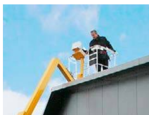
Uhlový výložník s možnosťou premostenia